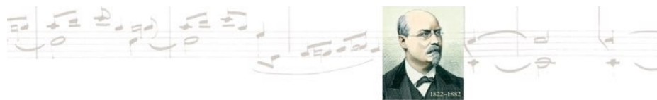
Joachim Raff Gesellschaft